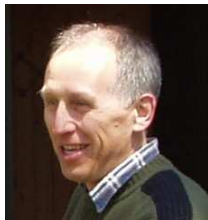
SP4JFR – Bolek